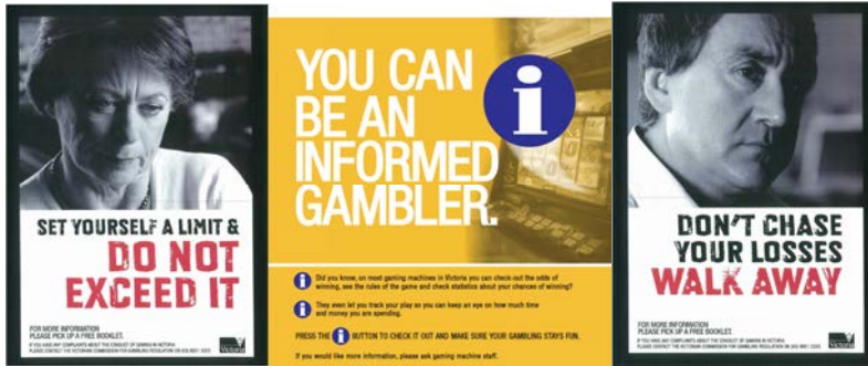
c) La disponibilità di servizi di supporto